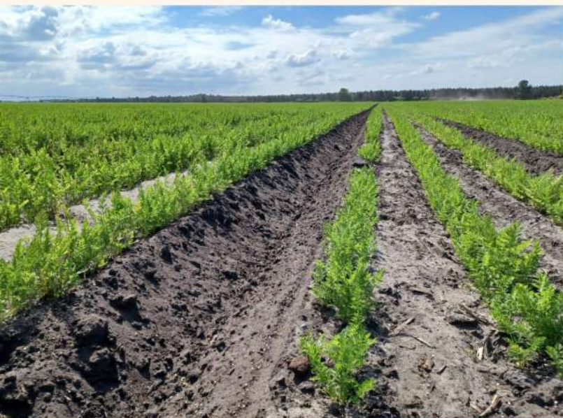
Un champ de carottes. à récolter dans environ 1 mois

Les apprentis observent la charrue au travail (préparation d'un semis de carottes)