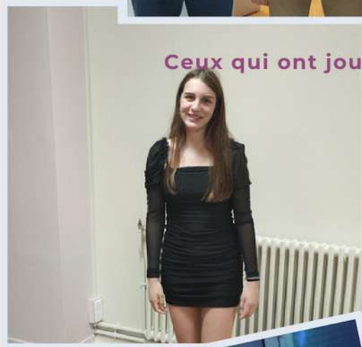
Ceux qui ont joué le jeu de la tenue de soirée