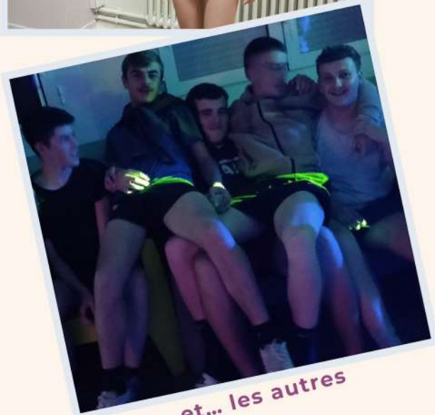
et... les autres