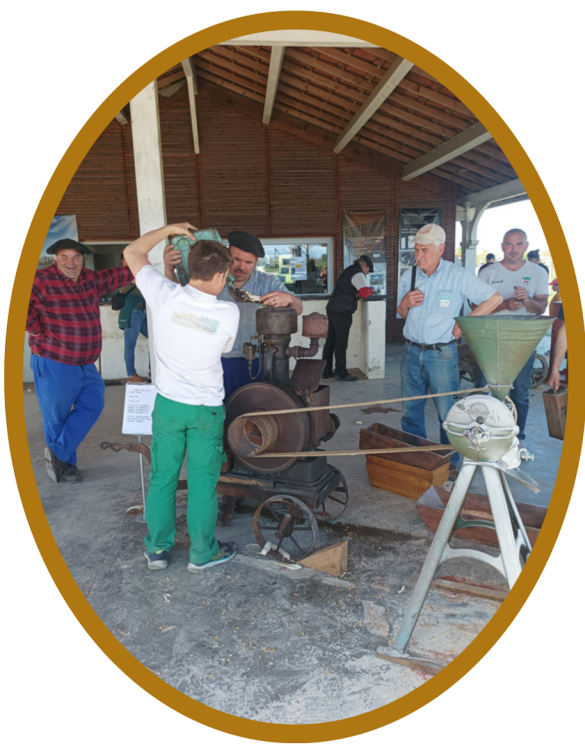
Présentation de matériel agricole ancien