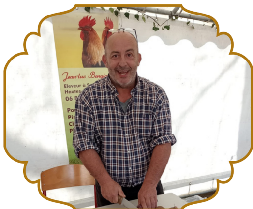
Le marché des générations