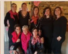
CANT E PALA

19H CONCERT A L'ÉGLISE AVEC LES GROUPES SÉMIADA ET CANT E PALA