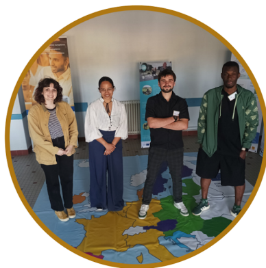
Europe Direct France