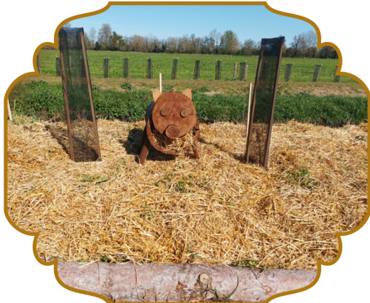
Le cochon maison à insectes des 3e