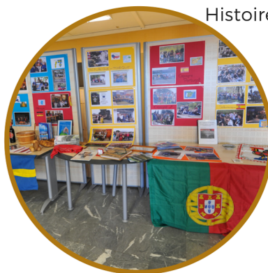
Histoire de la Coop'inter