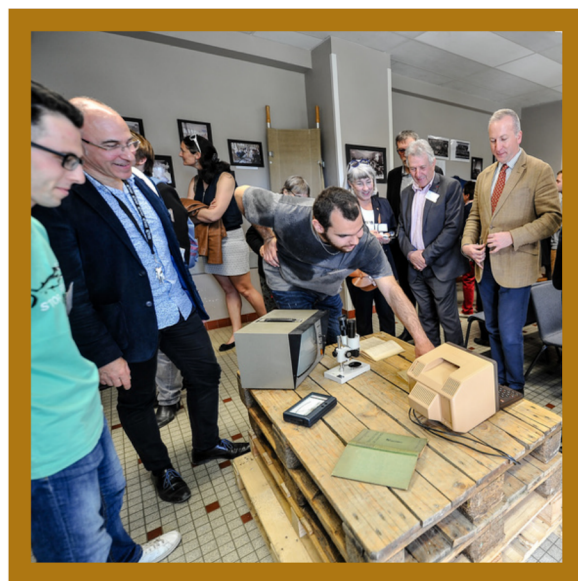
Le lycée au fil du temps