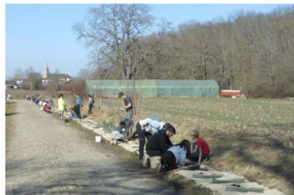
Vue d'ensemble de la haie d'Orleix