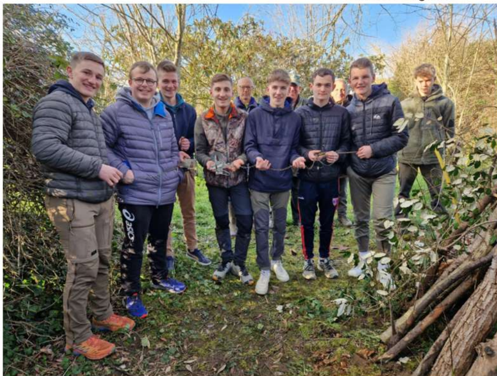
Les Terminales STAV et M Thion